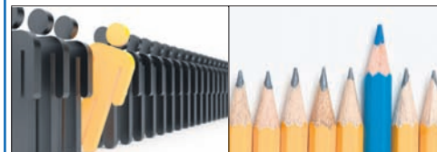
immagine: stateofmind.it e valconcanews.info

Venerdì 10 novembre dalle 15.00 alle 16.30 Centro diurno Lugano