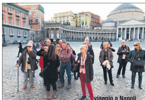
viaggio a Napoli

Un ringraziamento a tutti i partecipanti alle nostre manifestazioni ed un arrivederci al prossimo anno con un programma accattivante che prevede come clou la gita di quattro giorni a Cracovia. ■ Gerolamo Cocchi