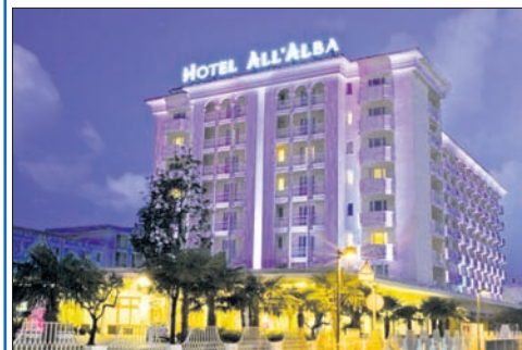
Hotel Terme All'Alba****, Abano Terme

Organizzato dalla Sezione di Lugano in collaborazione con altri enti